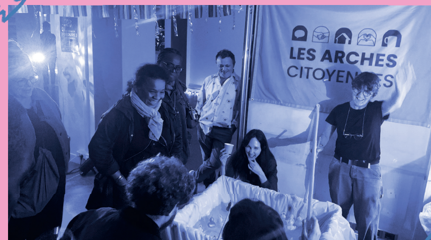
Sacrée pêche aux canards pendant la fête des Arches !